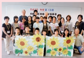
(ボランティアスクール)