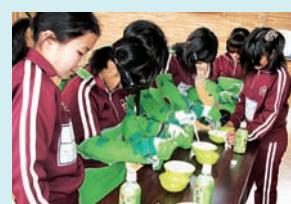
(青少年福祉体験学習)