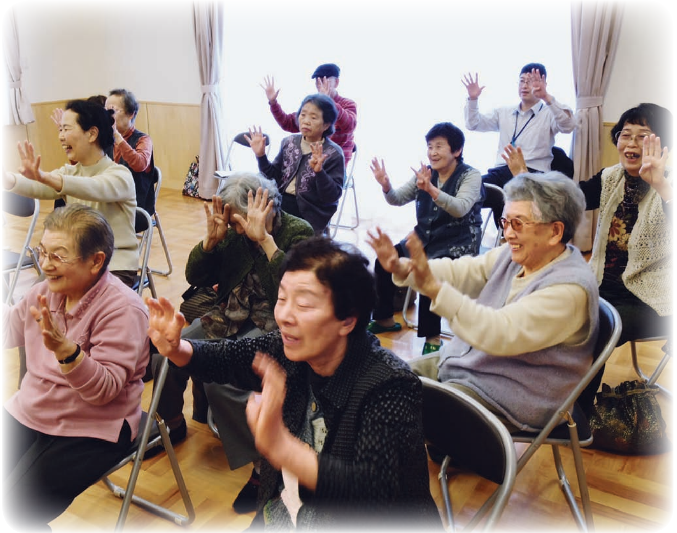
いきいきデイクラブ (南白土公民館)

第103号 平成24年7月10日発行 編集・発行 社会福祉法人 いわき市社会福祉協議会 広報委員会 いわき市平字菱川町1番地の3 (いわき市社会福祉センター内) TEL0246-23-3320 FAX0246-35-5031 ホームページ www.iwaki-shakyo.com メールアドレス master@iwaki-shakyo.com