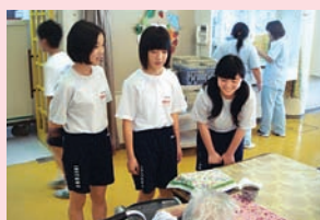
(青少年福祉体験学習)