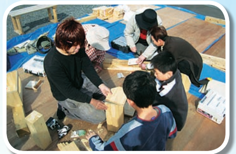
仮設住宅で行われた「木工教室」

定期交流サロンやイベントでは、親子で楽しむ「木工教室」や趣味を生かした「絵手紙教室」、介護予防の「健康体操」、就職相談会など、地域のボランティアの方々と協力しながら行っております。