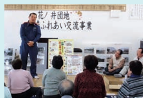
(地域ふれあい交流事業)