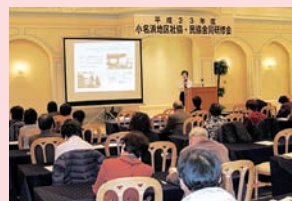
(社協・民協合同研修会)