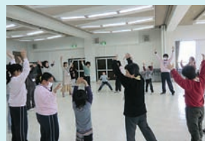
(障がい児余暇活動支援事業)