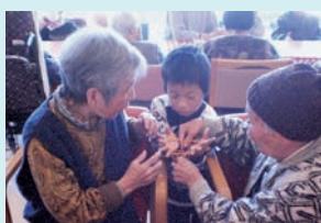
(児童福祉スクール)