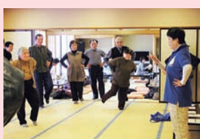
(みにミニデイサービス)