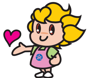
社協のイメージキャラクター「ふくみちゃん」