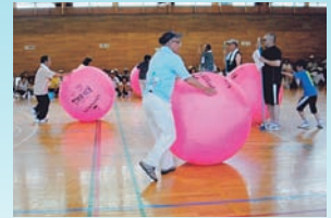
あすなる年輪ピクススポーツ大会