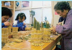
青少年福祉体験学習