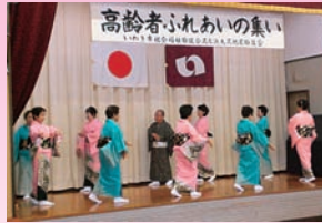
高齢者ふれあいの集い