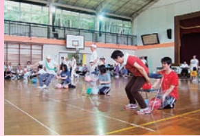
高齢者スポーツ大会