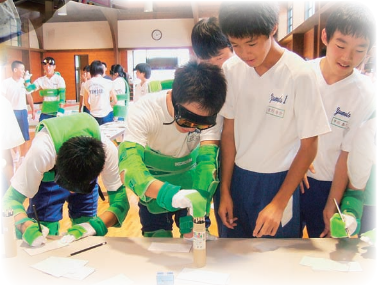
(青少年福祉体験学習)