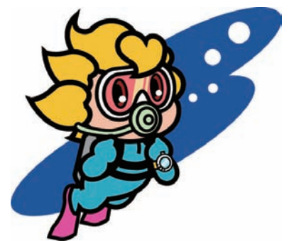
社協のイメージキャラクター「ふくみちゃん」