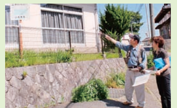
区長さんと一緒に避難所の確認