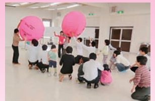
障がい児余暇活動支援事業