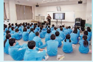
ボランティア育成講座