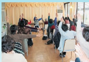
介護者リフレッシュの集い