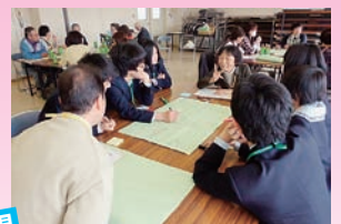
ボランティア活動育成事業