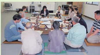
地域の福祉課題について協議

社協の理念でもありますが、「誰もが」「安心して」「暮らし続けられる」地域づくりについて皆さんはどのように考えますか。