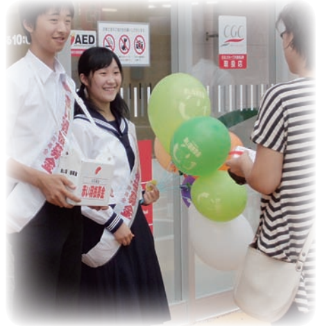
市内各地での街頭募金