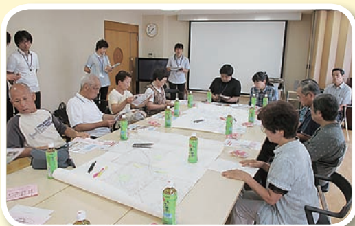
熱心に地域について議論を展開