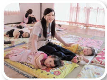
園児と触れ合う高校生

最後に、この体験の場を提供していただきました34施設等の皆様、ご多忙中にも関わらず、本当に温かく学生たちを受け入れてくださったことに厚くお礼申し上げます。