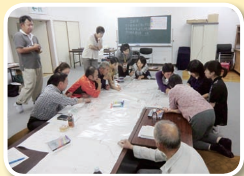
マップづくりで地域の福祉課題を把握

市内13地区において現在座談会を開催し、住民の皆さんの参加により、話し合いの場を持ち、地域福祉マップづくりを行っております。