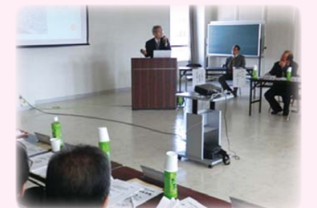
実践活動の事例発表の様子

いわき市社会福祉協議会では、「小地域福祉活動指定行政区連絡会」を定期的で開催し、本事業を実施するうえでの反省やさらなる効果的な事業の取り組みが出来るよう、指定地区間の交流や情報の交換を行っています。