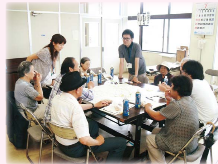
住民支え合い活動だけでなく、要援護者の把握や防犯・防災にも役立つマップを作成