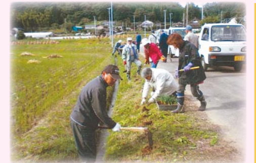
地域の美化活動を促進しましょう！