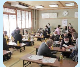
ボランティア講座