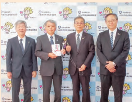
軟骨伝導イヤホン

耳が聞こえづらい高齢の方や難聴の方が来所された際に、本会窓口などで活用させていただきます。ありがとうございました。