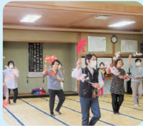
地域高齢者交流事業