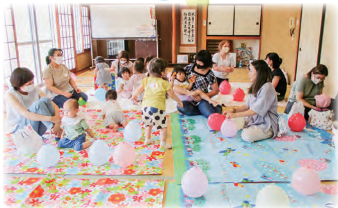
<子育てサロン（風船遊び）>