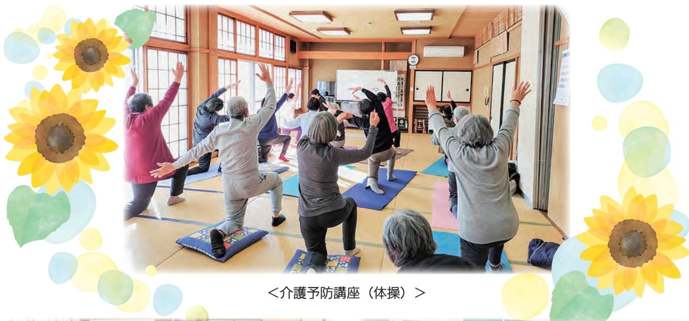
<介護予防講座（体操）>

社会福祉法人 いわき市社会福祉協議会 いわき市平字菱川町1番地の3 (いわき市社会福祉センター内) TEL0246-23-3320 FAX0246-35-5031 ホームページ https://www.iwaki-shakyo.com メールアドレス master@iwaki-shakyo.com