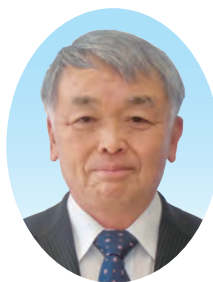
社会福祉法人 いわき市社会福祉協議会