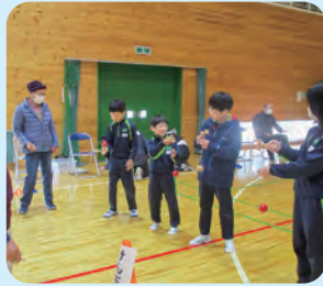
まなびの里田人交流事業