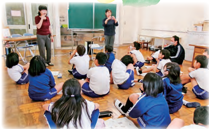
<青少年福祉体験学習（手話教室）>