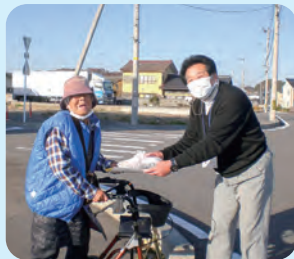
夕食宅配サービス