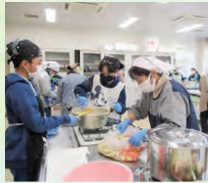
青少年地域交流事業