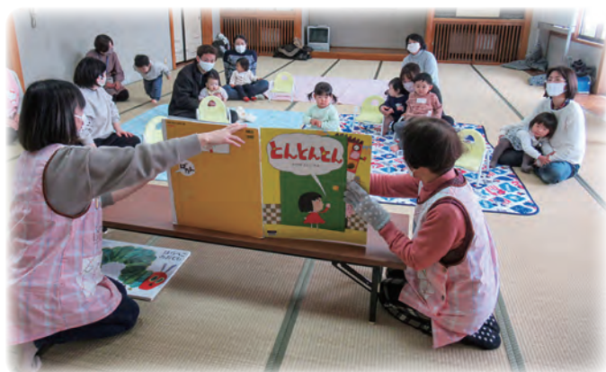
<子育てサロン（読み聞かせ）>