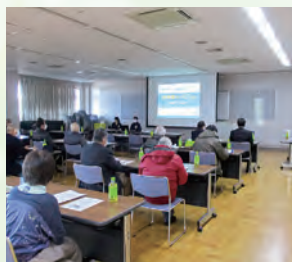
社協・民協合同研修会