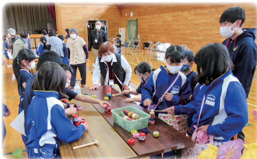
<敬老交流会（昔遊び）>

社会福祉法人 いわき市社会福祉協議会 いわき市平字菱川町1番地の3 (いわき市社会福祉センター内) TEL0246-23-3320 FAX0246-35-5031 ホームページ https://www.iwaki-shakyo.com メールアドレス master@iwaki-shakyo.com