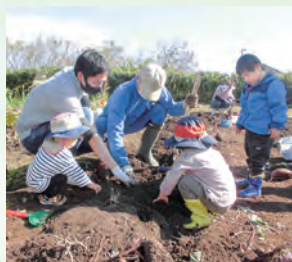
ふれあい農業体験