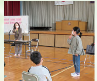
青少年福祉体験学習