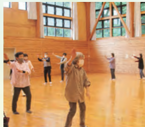
地域高齢者交流事業