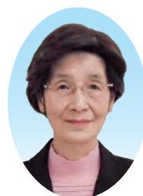
社会福祉法人 いわき市社会福祉協議会