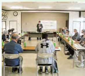
ボランティア育成講座