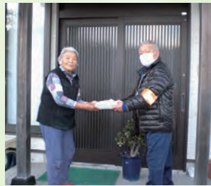
夕食宅配サービス