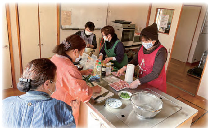
<つどいの場（調理実習）>