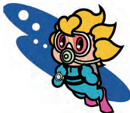
社協のイメージキャラクター「ふくみちゃん」